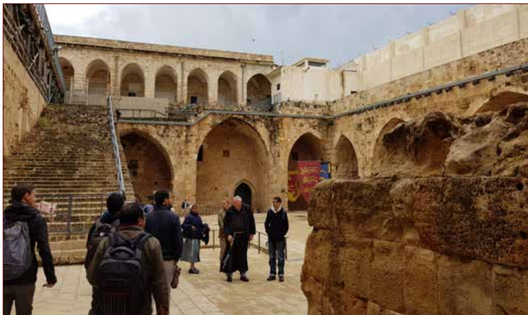
Studenti dello SBF in visita alla Cittadella crociata di Acco

Siti come Megiddo, Dan e Hazor consegnano tracce significative e preziose della presenza della civiltà cananea e israelitica di epoca monarchica. È stato possibile cogliere alcune caratteristiche delle città antiche: le strutture di accesso e di difesa, l'organizzazione dello spazio sacro, caratterizzato dalla presenza di templi, numerose steli e altari che forniscono fondamentali informazioni