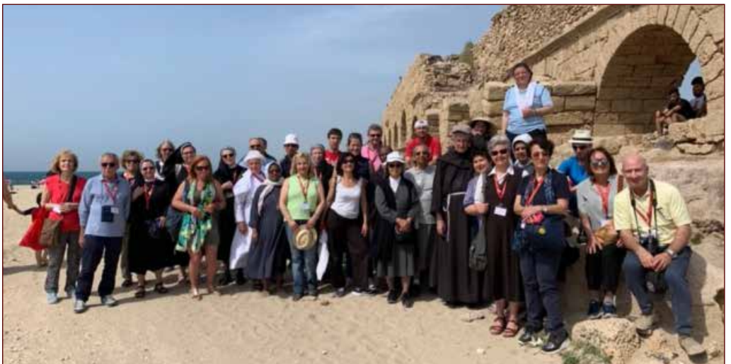
I partecipanti al CABT in aula e durante l'escursione a Cesarea Marittima