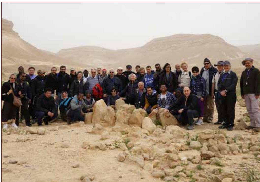
I partecipanti all'escursione nel Negev sull'altopiano di Har Karkom