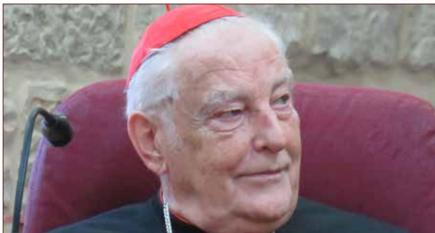
Cardinale Zenon Grocholewski a San Salvatore

ha potuto vedere coronato il suo desiderio di ottenere il titolo di “Università Pontificia” 2 . Ciò è avvenuto con la decisione del Santo Padre all’inizio del gennaio 2005 3 . La nuova Facoltà, infatti, ha dimostrato di far onore alla costituenda Università. Per questo rinnovo le mie congratulazioni.