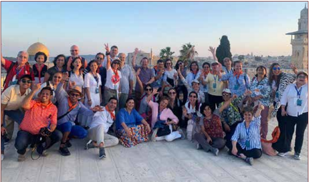
Gruppo della Università Javeriana di Bogotá