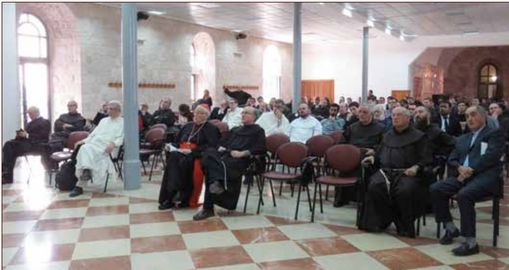
Panoramica dei partecipanti alla Prolusione

14. La Verbum Domini , cit., nota anche l'importanza dell'Eucaristia in quanto essa "ci apre all'intelligenza della sacra Scrittura" (n. 55).