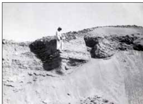
Sulla Ziqqurat di Eridu (12 settembre 1955)

Ci siamo avvicinati il più possibile alle rovine coperte di sabbia della città di Eridu e la macchina si ferma. Scendiamo e ci avviamo