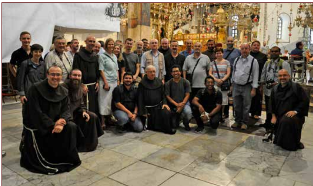
Gruppo di professori e studenti in visita ai restauri di Betlemme

la proiezione del film Tessere di Pace in Medio Oriente (regia di Luca Archibugi, Rai Cinema 2008).