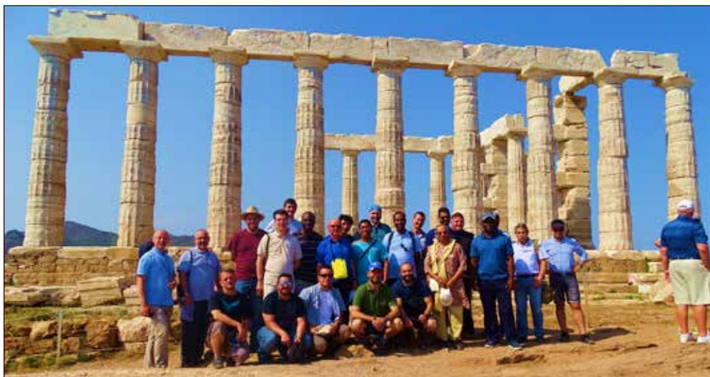
In questa e nella pagina seguente, due immagini dell'escursione in Grecia

Martedì 18 ci spostiamo verso Berea e celebriamo la Messa al Bema sul quale è stato costruito un altare in memoria del passaggio di San Paolo narrato da At 17,10-15. Successivamente, a Verghina, visitiamo la grande necropoli, contenente più di trecento tumuli, dei quali il più antico risale all'Età del Ferro e il più recente al periodo ellenistico. Tra questi è stata identificata anche la tomba di Filippo II il Macedone, padre di Alessandro Magno e al suo interno sono stati rinvenuti oggetti in