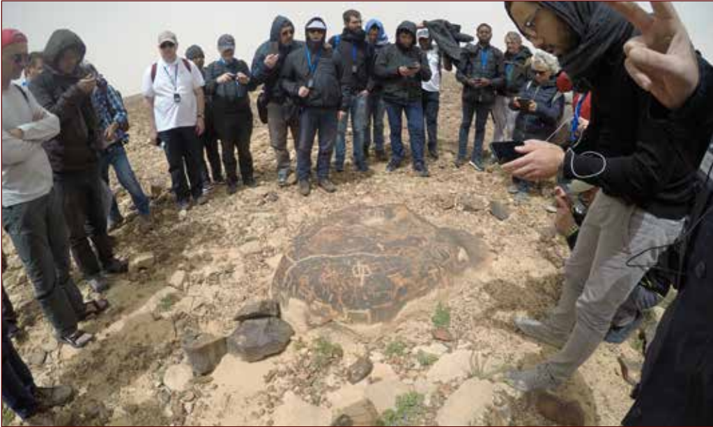
Alla scoperta delle incisioni rupestri di Har Karkom