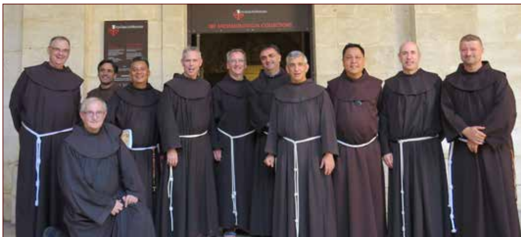
Il Ministro Generale in visita al Museo dello SBF con i membri del Definitorio

Dal 23 al 26 aprile 2019 si è svolto, presso l'auditorium del convento di S. Salvatore, il 44° Corso di aggiornamento biblico-teologico (CABT) dal titolo "Profetismo e apocalittica".