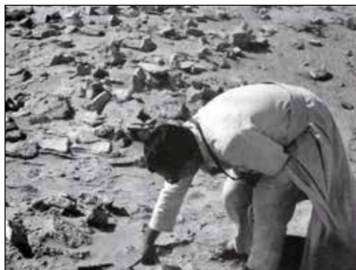
La raccolta dei mattoni a Eridu

La città di Nassiriya, sull'Eufrate, è in pieno deserto e quindi ha un clima torrido; in ospedale in quei giorni erano 40 gradi all'ombra e mano a mano che io riprendevo forza sentivo maggiormente il caldo. Allora chiesi, insistei tanto per poter essere dimesso dall'ospedale. Mi misero in grado di poter viaggiare sul treno in una cuccetta e così potei fare il viaggio fino a Baghdad dove fui ospite dei padri gesuiti nel loro collegio. Questi mi prodigarono tutte le cure e devo dire ancora un particolare grazie nel ricordo di un infermiere dei padri gesuiti. Questi aveva esercitato tale