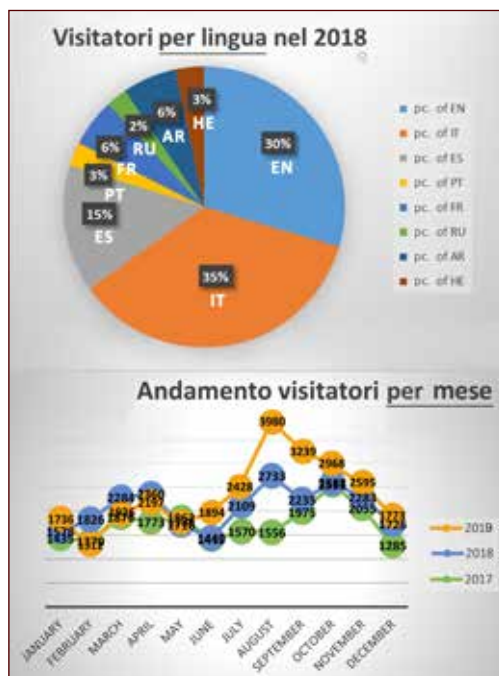
Visitatori al Museo negli anni 2017-2019 per le sezioni "Via Dolorosa" e "SBF Archaeological Collections"