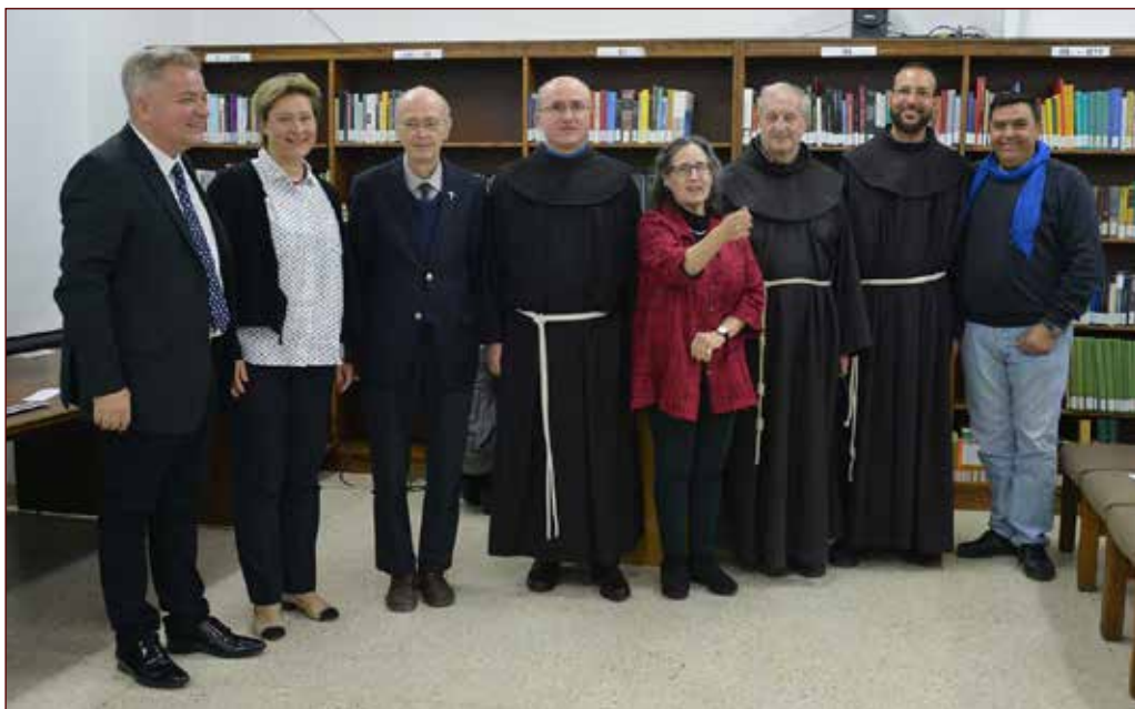
Partecipanti alla presentazione del volume Machaerus III