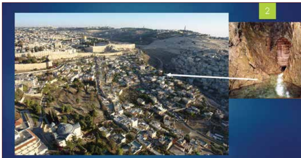
La Città di Davide

in loco ha consentito migliori datazioni dei livelli ed ha fornito interessanti elementi per la comprensione dell'evoluzione del sito dall'epoca del Medio Bronzo al periodo Romano.